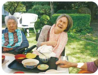
箸が転んでもおかしな年頃なの