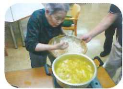
「こうするんだよ」名人の言

若い頃よく作っていたというほうとうをご馳走になりました。麵から手作り。さすがです。来年もご馳走してね★