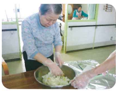
おにぎり、上手に握れるかしら・・・

いつも小食の方も、この日はやはり沢山食べていました。とっても美味しかったですね♪