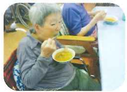
大変おいしゅうございます