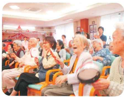
笑いの止まらない、職員アトラクション★