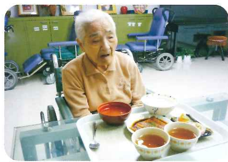
とっても美味しかった★