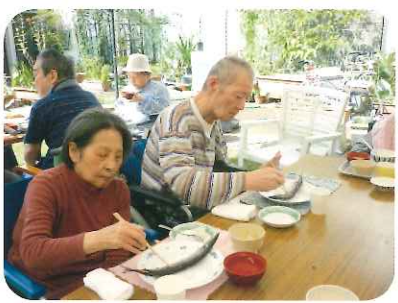
さすが皆さん、サンマの骨をとるのが上手です