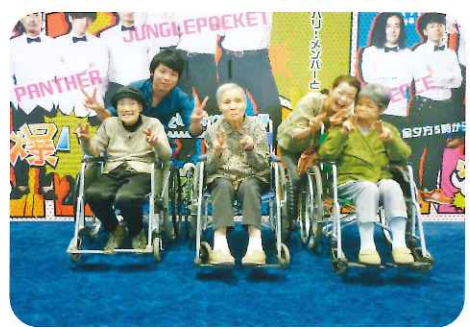
とっても楽しかったあ～♪ また行きましょね！

三丁目はいつも元気な声が聞こえて、賑やかなところですよ。利用者も職員も豪快な笑い声が響いています。テレビも小さな子供や動物が出ているものも好きですが、お笑い番組も大好き！そんな様子を見て、九月の外出企画は幕張イオンにある「よしもと」に行ってきました！