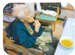
「もつとないのかい？」