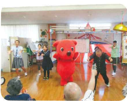
ダンスの決めポーズ! チーバ君もお上手です♪

君! 青春をテーマに学フンとセーラー服に身を包んだ職員も、ご利用者の皆様が大喜びで迎えてくださり、温かい声援で見守っていただきました。