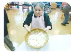
見事に打ちあがりました。さすが、名人！