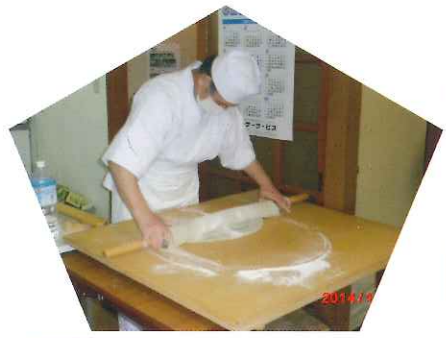
《そば打ち実演》で新そばを堪能しました。打ち立て、茹でたては最高！！