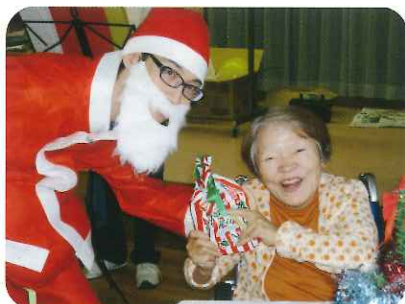
「プレゼント、ありがとう」