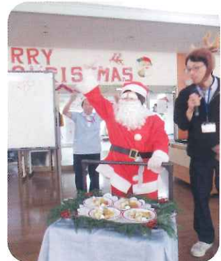
施設長サンタからのクリスマスプレゼントキ!!