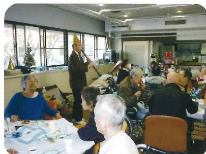
クラリネット生演奏 「シングルベル〜♪」