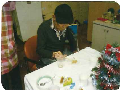
ゲーム、箸使い上手ですね。