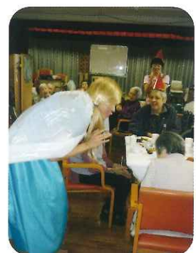
「わあ〜 びっくりした!」