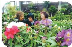
バラ園にお出掛けした後は、パン屋さんで珈琲ブレ

春 らんまんの季節、南デイホームでは、ゆったりとした気持ちで楽しい時間をお過ごしいただけるよう、様々なプログラムを用意しております。