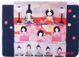
《雛飾り》 今年は五人ばやしが増えました。