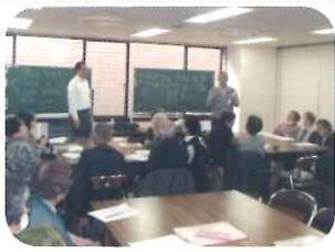
包括主催 介護予防教室 「元気クラブ」

り、『介護保険や福祉サービス』『介護予防や介護について』『認知症の相談』等、また、その他『お困りごとや悩み事』等の相談を、総合的に受け付け、本人・家族と相談しながら、必要な支援に繋がるようにお手伝いしております。お気軽にご相談ください。