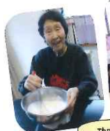
珈琲ゼリーのクリームをふっくら泡立て!!