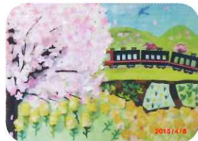
《のどかな春の風景》 桜となの花 田舎道を電車が通ります。