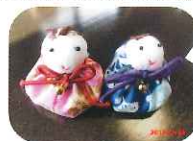
3月のクラフト ミニお雛様作り