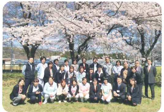
満開の桜の木をバックに合同記念写真

二日（木） には、協力病 院であるセン トマーガレッ ト病院の新入 職員と合同で、 恒例のお花見 昼食会が緑地 公園で開催さ れ、満開の桜 の下、楽しい 時間を過ごし ました。同日の夕 方には、グリーン ヒル互助会による 新人歓迎会が開か れました。理事長・ 常務の言葉、そ して新入職員の自己紹介、各部署の担当職員 より歓迎の言葉をいただきました。お料理を 囲み、談笑しながら同じ部署の職員と一足先 に交流をすることができ、とても良かったと 思います。