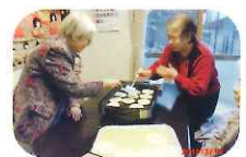
餃子の皮でピザ作り! トッピングをお楽しみ