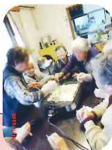
たこ焼きをひっくり返す。