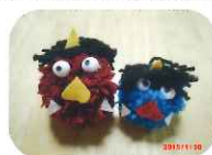
2月のクラフト 毛糸を巻いて鬼作り