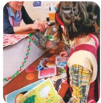
キッズクリスマス会 みんなでケーキを作って、クイズをして プレゼント交換もしたよ！ 楽しかったよ！！