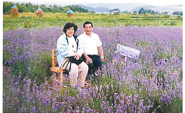
夫婦での北海道旅行

くことがで きました。 体調を崩す ことが多かつ た母ですが、 いろいろな ことにチャ レンジする ことが好き で、家族も 困ってしま うことがあ りました。