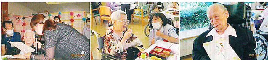
ご長寿祝 白寿を迎えました