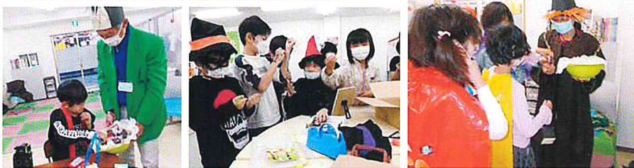
ハロウィンだ～！！「トリックオアトリート」を言ってお菓子を貰う日。顔にも手にもペインティングしたよ。み～んなかっこよく変身しました！！