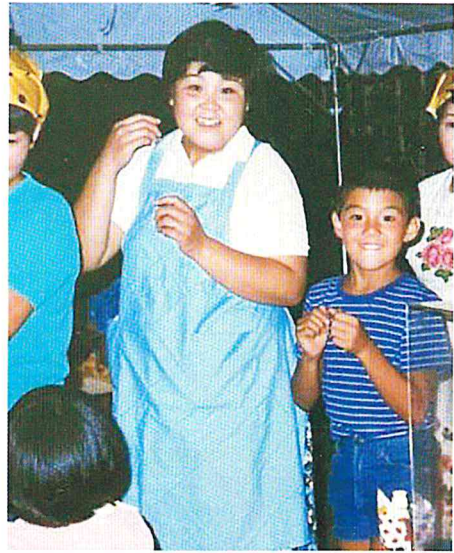
幼稚園の夜祭屋台で フランクフルトを販売（長男と）