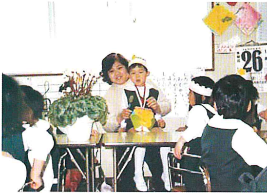
仕事の合間に 幼稚園での誕生会に参加（次男と）

ち、地元 の企業に 就職した と聞いて おります。 機会に、 飲食業を 営む父の もとへ嫁 ぎ、千葉 市へ来ま