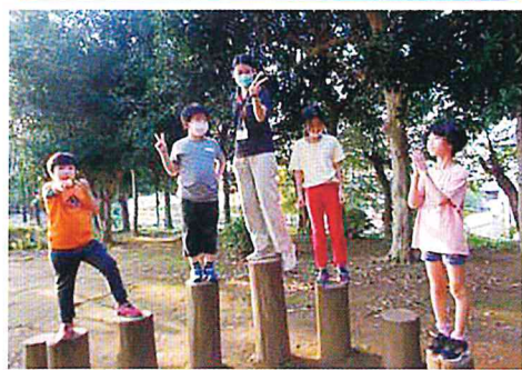
萱田近隣公園の丸太の上でバランス競争！だれが一番？