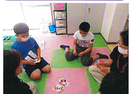
ウノや人狼ゲームが人気だよ！負けても怒らない！キッズの『やくそく』です