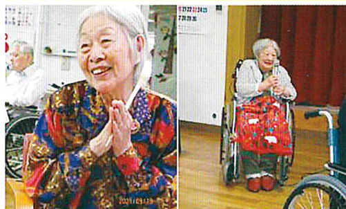
お孫さんからの ビデオメッセージに 感激