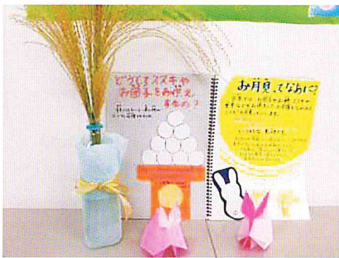
今年の十五夜は、8年に一度の満月だよ！家でママとお団子を作るよ