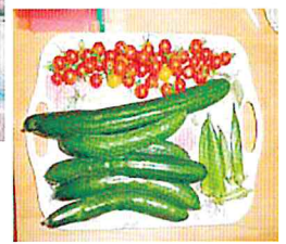
沢山の野菜が収穫 出来ました