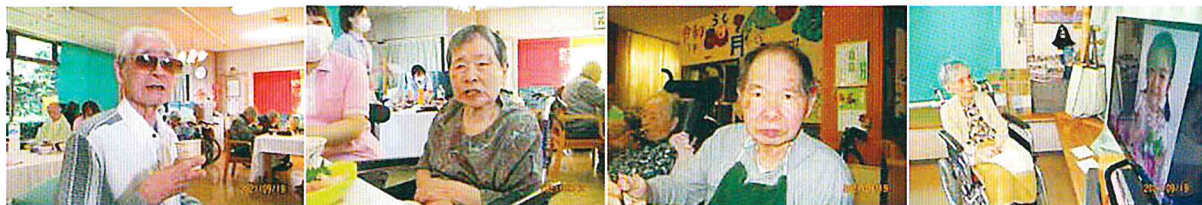
美味しくて タモリになっちゃう