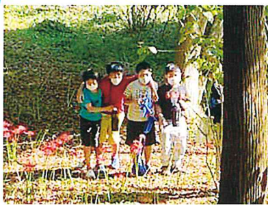
村上緑地公園の彼岸花が真っ赤だったよ