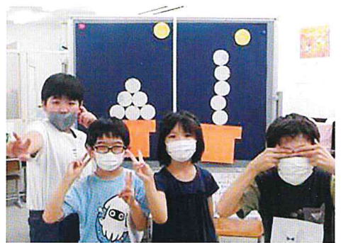
Aチーム・Bチームできれいなお団子が積みあがりました！