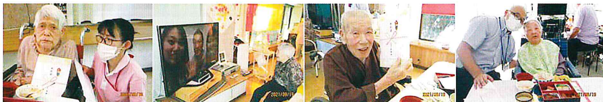
そんな顔しないで 嬉しい顔です