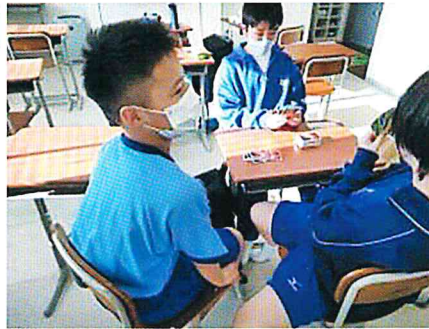
中学校のジャージを着てみんなでカードゲーム！