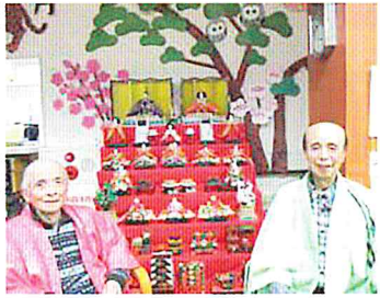
初参加のお内裏様

未曾有の災禍コロナも三年目を迎え、日常と非日常が曖昧な生活に慣れてしまった今日この頃。デイサービスの皆様は健康維持に励まれ、変わらず元気に一日一日を過ごされています。「これまで通り」が難しい状況の中で、感染対策を徹底し、普段通りに活気のある明るい雰囲気です。継続することの大切さ、難しさを改