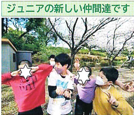
ジュニアの新しい仲間達です