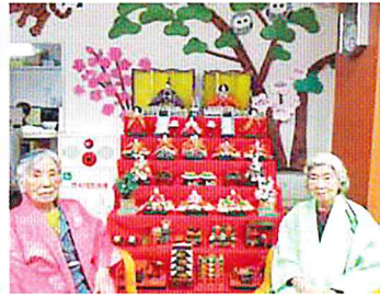
笑顔が素敵なお雛様

送 迎の車の中からも、沢山の花を見ることの出来る季節になりました。市内の桜を回り、入学式へ向かう児童の元気な姿を見ると春の訪れを感じますね。今年度もグリーンヒルデイサービスを宜しくお願い致します。