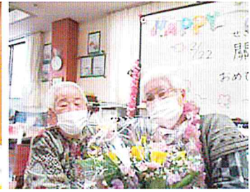
誕生日はお仲間と一緒に

送 迎の車の中からも、沢山の花を見ることの出来る季節になりました。市内の桜を回り、入学式へ向かう児童の元気な姿を見ると春の訪れを感じますね。今年度もグリーンヒルデイサービスを宜しくお願い致します。