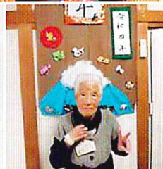
三月の壁面飾りと 個人作品