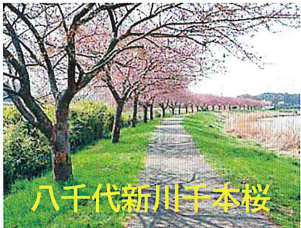
八千代新川千本桜