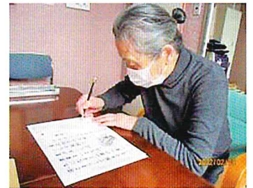
公文で集中力を発揮

これからのデイサービスに求められることの大きな一つに、「成果を出すこと」が挙げられます。