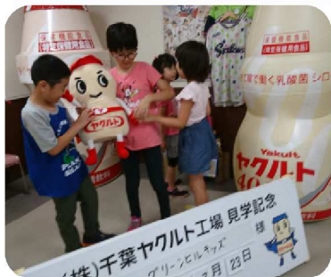
ヤクルト工場に行ったよ！『シロタかぶ』や『ビフィズス菌』はすごい力があるんだって！！