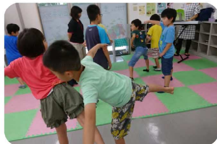
リトミックはピアノに合わせて楽しい時間！！