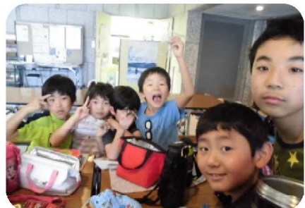
千葉県中央博物館で楽しいお弁当タイム！体験コーナーでは鹿の骨をさわったよ！