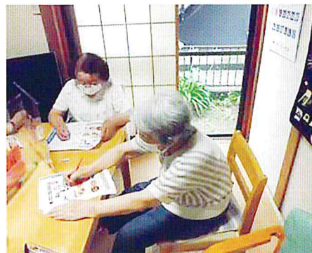
計算問題考え中です…