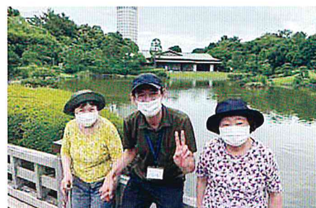
一休みも絵になります