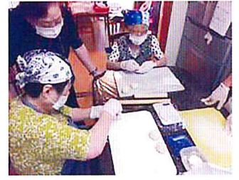
この作業はお手の物！