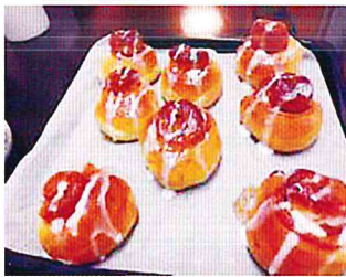
シナモンロールが 出来ました