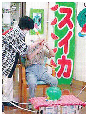
スイカ割り 本物はのちほど

食事の前には皆様集まって「お風の集い」を行います。時には管理栄養士や看護師がそれぞれ専門性を活かして季節ならではの栄養の摂り方や、健康法を紹介しています。ご家族向けにプリントも用意していますので、ご利用ください。