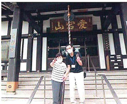
ピースと笑顔が素敵です