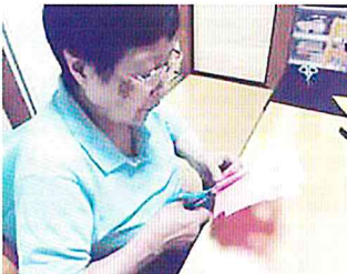
花火を盛り上げようと

6月1日、地域密着型通所介護グリーンヒル八千代台南デイホームが開設となりました。「地域密着型通所介護」とは、要介護状態となった場合においても日常生活のサポートをし、可能な限り 住み慣れた自宅や地域 で生活を送れるように、介護が必要な高齢者の孤立感解消、心身の機能維持などを目的として提供される介護サービスです。デイサービスの中でも18名以下の小規模利用者で運営しているサービスを「地域密着型通所介護」といいます。