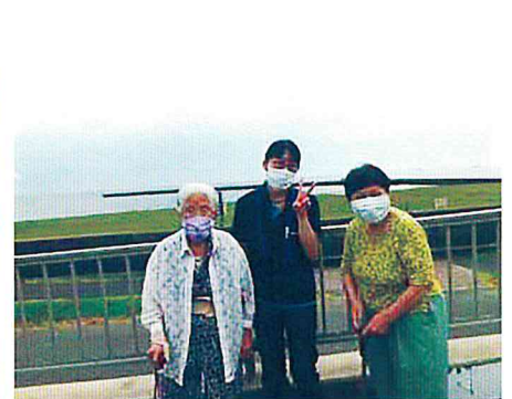
潮風を感じました