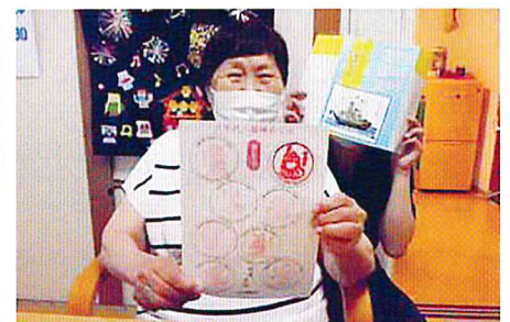
八福神コンプリート！！