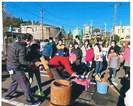
3年ぶりのお相撲さんとお餅つき つくたてのお餅はおいしかったあ～