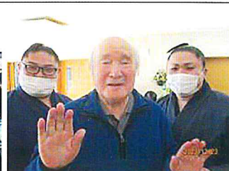
どすこいポーズでパチリ