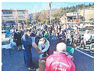
つくたびに 歓声が上がります