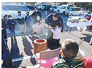
ちょっと緊張しちゃうね