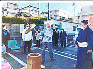
「うまくつけてるかな」 「お上手です」