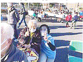
寒いけど笑顔でピース