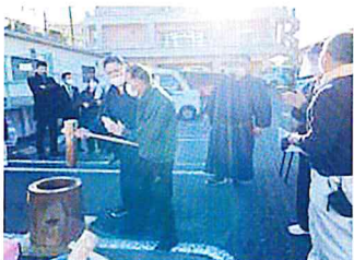
「さすがですね」と お相撲さんに拍手