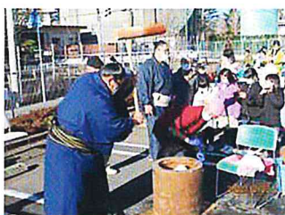
秋良さん、よいしょ～