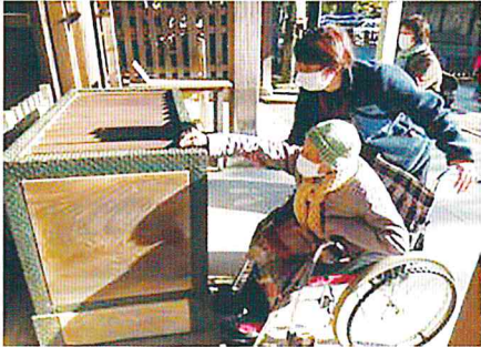
お賽銭を入れましょう