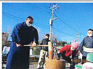
秋良さん、温厚な笑顔で 力強いつきです