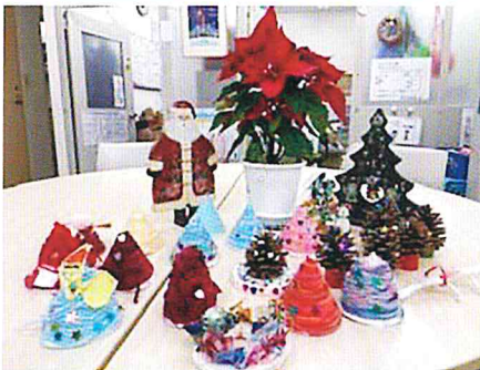
Xmas工作 毛糸や布で可愛いリースや三角帽子の完成です！