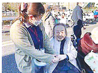
皆で集まると温かいね