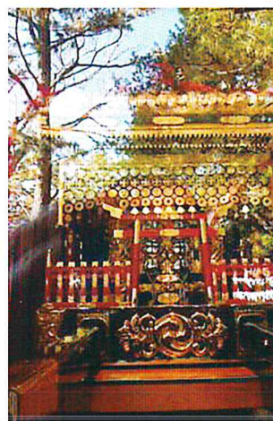
とても煌びやかですね