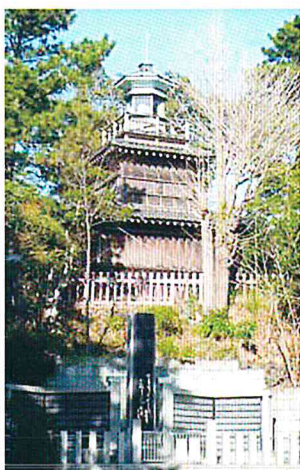
とても高いですね