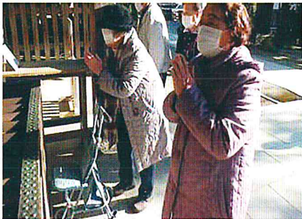
今年も健康でいられますように