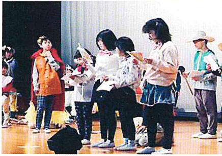
『長靴をはいたねこ』の朗読劇はみんなの心がひとつになって大成功でした！