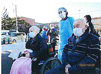
がんばれ～がんばれ～