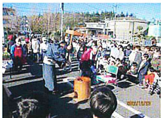
テンポよくつく姿に 一同くぎ付けです