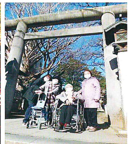
鳥居の下でハイチーズ！