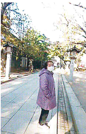
こっち向いて下さい