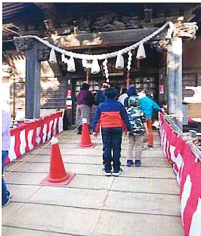
新しい年 皆で飯綱神社に初もうでをしました お願い事は何かな???