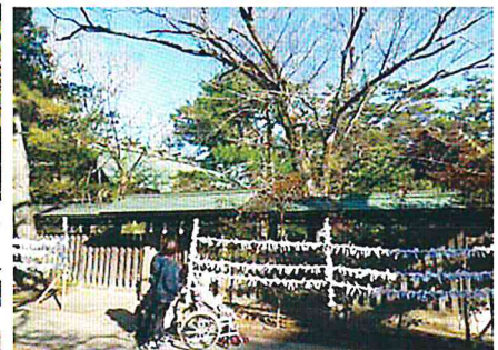
天気にも恵まれました

新 年最初のイベントとして、船橋大神宮へ初詣に行ってきました。天気は快晴、この時期にしては温暖で絶好の参拝日和です。「結構大きな神社ですね」「人が入っているわね」と新年の賑やかな雰囲気皆様思わず笑みがこぼれています。