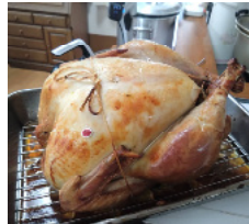
クリスマスターキー