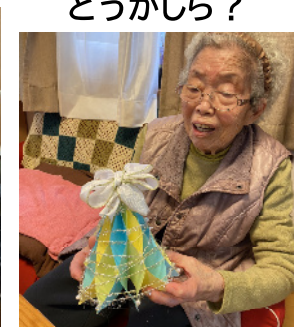
立派なツリーが 出来て良かったわ