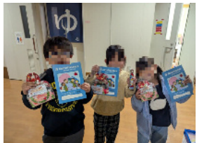
(株)アステカ様よりプレゼント

サンタクロースがプレゼントを積んでフィランドから出発した頃、十二月十七日に、ふらっとホームグリーンヒルでは少し早めのクリスマス会を実施しました。