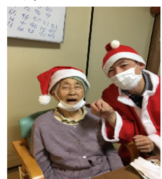
キーホルダーの プレゼントです