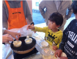
ロリポップチョコ体験