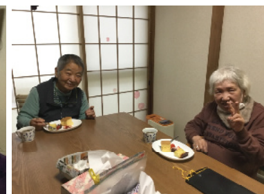
ケーキも美味しいわ