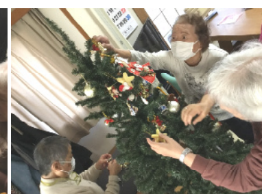
ツリーの飾りつけをしました