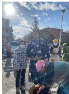
やっぱり大きいね