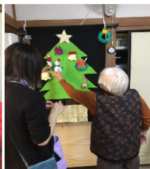
これはこの辺で どうかしら?