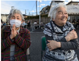
良いお天気だけど ちょっと寒いね