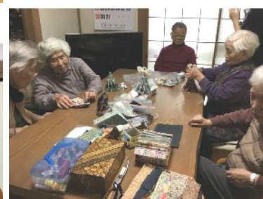
皆様真剣に 取り組まれています