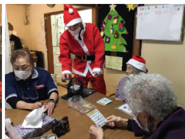
ビンゴゲーム、スタートです