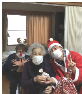
ビンゴおめでとう!