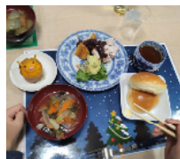
【参加下さった皆様は総勢百一十二名。このパーティーをきっかけに、初めて来苑された方も沢山いらっしゃいました。この縁が脈々と広がって、より多くの方々に憩いの場としてのふらっとホームグリーンヒルを知って頂けたら、私達スタッフにとって一番のクリスマスプレゼントです。

最後にになりましたが、クリスマスのみならず、日々長きにわたり、活動を支えて下さっているボランティアの皆様、企業、農家の皆様、地域の皆様に改めて御礼申し上げます。今後もしも楽しい、美味しい、嬉しいをお届け出来るよう頑張ります。皆様宜しくお祈りします。