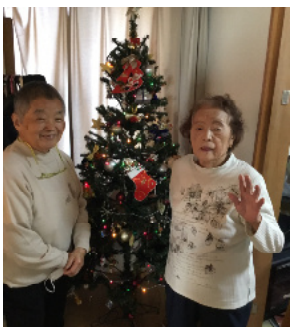
飾り付け 頑張りました