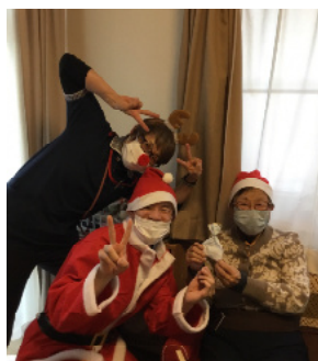
トカイさんも一緒に