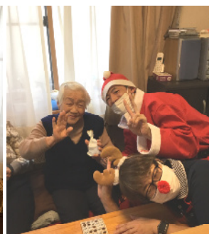
どうもありがとね