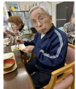
美味しくて満足です