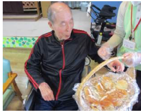
どのパンにしようかな～？