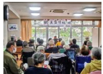
演奏を真剣に聞いています