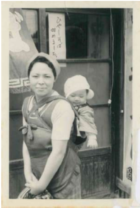
トシ様27歳 長男との2ショット