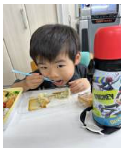
お代わりたくさんしました

4月15日(水)、グリーンヒル八千代台キッズルームとの合同企画で、餃子づくりを楽しみました。ご利用者と子ども達が一緒に餃子を包みながら、「こうやってやるんだよ!」と優しく教える姿や、笑い合う様子が見られました。出来上がった餃子はそのまま皆で昼食としていただき、「美味しいね」と会話も弾み、さらに交流が深まるひとときとなりました。