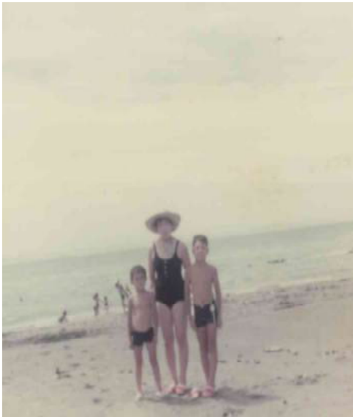
家族旅行 千葉の海岸にて

に中華そば店を構え、二人三脚で駆け抜けた日々。妻はグラウンドゴルフで何度も優勝し、オートバイを颯爽と乗り回す、実に活動的な女性でした。時には取っ組み合いの喧嘩もし