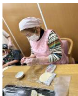
包むの何年振りかしら