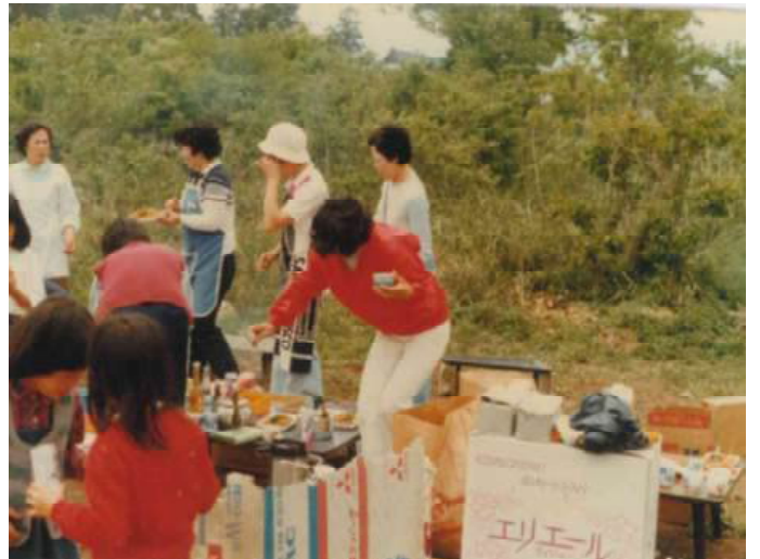
子供たちの子供会?のイベントの一コマ

写真は色あせても、共に歩んだ日々の記憶は、今も私の中で鮮やかに息づいています。 今後とも、何卒宜しくお願い致します。