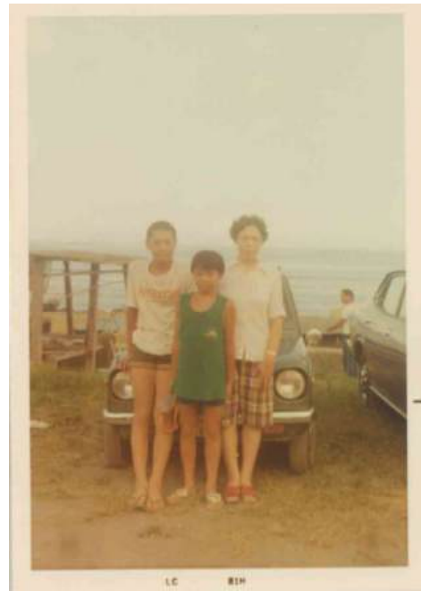
子供たちもスクスクと成長し、 今ではしっかり支えてくれています

に中華そば店を構え、二人三脚で駆け抜けた日々。妻はグラウンドゴルフで何度も優勝し、オートバイを颯爽と乗り回す、実に活動的な女性でした。時には取っ組み合いの喧嘩もし