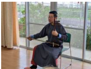
二胡の音色に癒されました