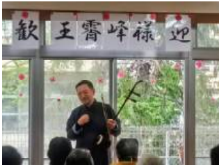
小ぶりな楽器です