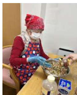
味付けお任せしました