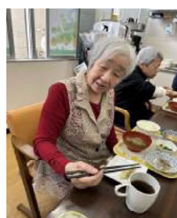
美味しく出来ました