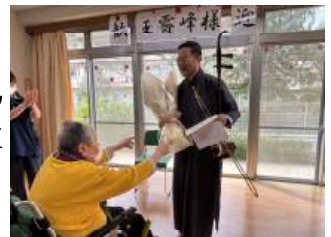
リクエスト曲ありがとうございます