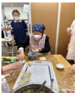
餃子包むの初めてなのよ